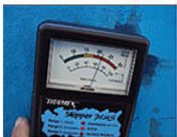
Presenza di osmosi