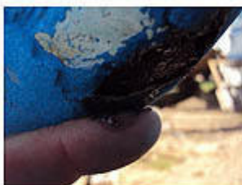
Acqua nella pala timone