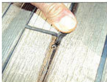
Comenti avvitati "alla traditora"