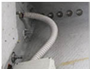
Attacco scafo coperta