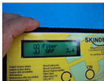
Presenza di osmosi