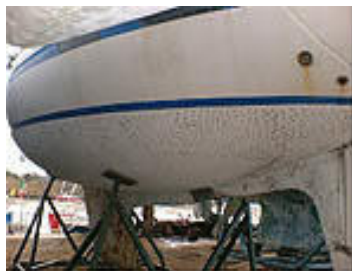
Scafo con osmosi